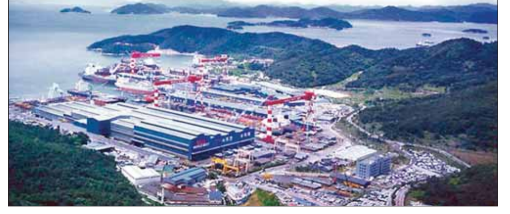
Güney Kore STX tersanesinin bu yıl sonuna kadar 29.5 milyar dolarlık sipariş alması beklenmektedir.